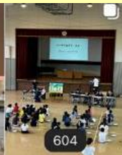
ラッキークローバー小学校公演