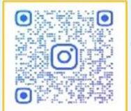
けやきの家Instagramを始めました